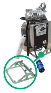
Base para instalación en el suelo