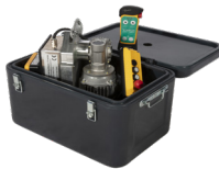
Caja de transporte