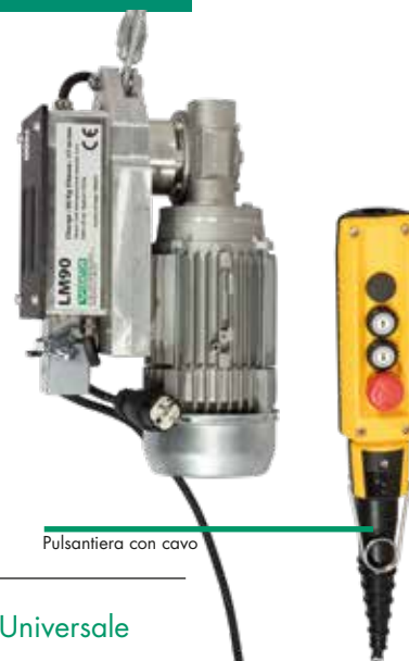
Pulsantiera con cavo