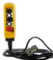
Boîte à boutons