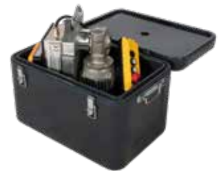
Coffre de transport