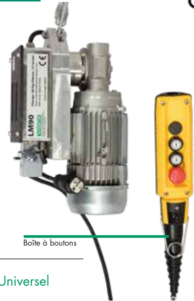
Boîte à boutons