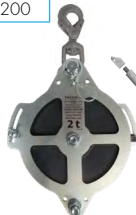
Puleggia UPS2T con gancio autobloccante semirostante per sollevamento (<2T) o rinvio dei carichi (<1T) Kit asta per il fissaggio nel vano ascensore disponibile