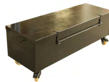
Contenitore metallico per il trasporto con 4 ruote (240 litri)